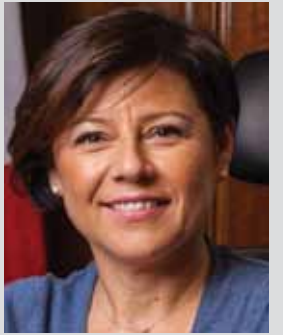
Paola De Micheli

LIVORNO - Se non saranno nati contrordini - e di questi tempi è abbastanza frequente - domani giovedì 28 il ministro delle Infrastrutture e trasporti Paola De Micheli sarà nel porto della Toscana in visita ufficiale. Lo riceveranno le autorità delle istituzioni, a cominciare dal presidente della Regione Toscana e dal presidente dell'Autorità di Sistema Portuale.